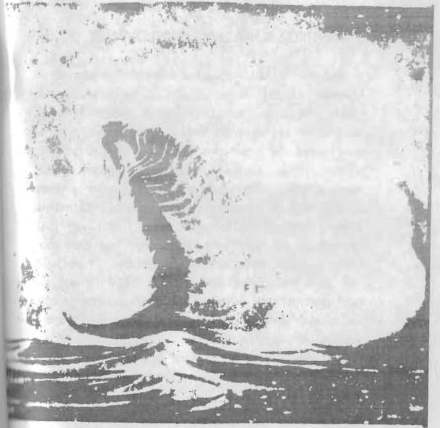
Bilden föreställer Södra Stillahavets havskönung. Varelsen kan upptäckas endast med hjälp av klärvoajans och den hör till naturandarna.

och folk fortsättningsvis håller Naturen och naturkrafterna som sin Gud så är det fel med tanke på de krafter som ligger till grund för hela Universum som t.ex. Kristus, Lucifer och Satan. Gud kan här inte som person ta del ty han är opartisk och understöder allt och bestraffar och belönar alla med karmalagen. Därför anser jag att varje människa först måste ära Gud. Efter detta kan var och en som tror ha som sin andliga ledare Kristus, Lucifer eller Satan. Jag har tidigare i denna bok, och i dess första del, berättat hur detta i praktiken är möjligt. I den Ursprungliga Svarta Bibeln finns beskrivet bl.a. hur elementaler används i många samma sak i denna boks första del.